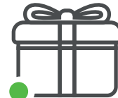
Bonificación por permanencia